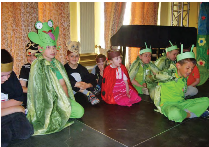
III Festiwal Teatralny „Bajkolandia” – „Calineczka” w wykonaniu uczniów naszej szkoły – 2010 rok.