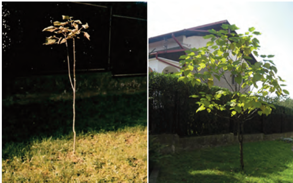
Jubileuszowe drzewo w szkolnym ogrodzie wczoraj i dziś...

„ O cóż jest piękniejszego niż wysokie drzewa, W brzoje zachodu kute wieczornym promieniem, Nad wodą, co się barw blaskiem rozlewa, Pogłębiona odbitych konarów sklepieniem...” „Wysokie drzewa” Leopold Staff