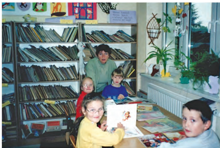
W szkolnej bibliotece