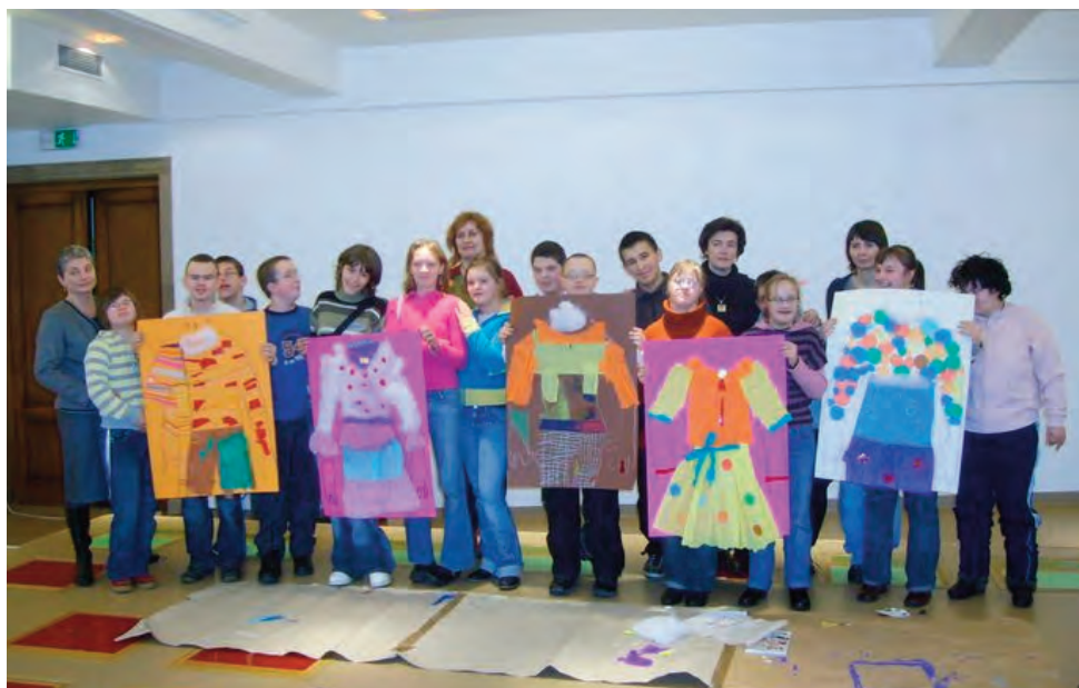
Warsztaty edukacyjne "Historia mody" w Muzeum Narodowym w Krakowie - rok szkolny 2009/2010