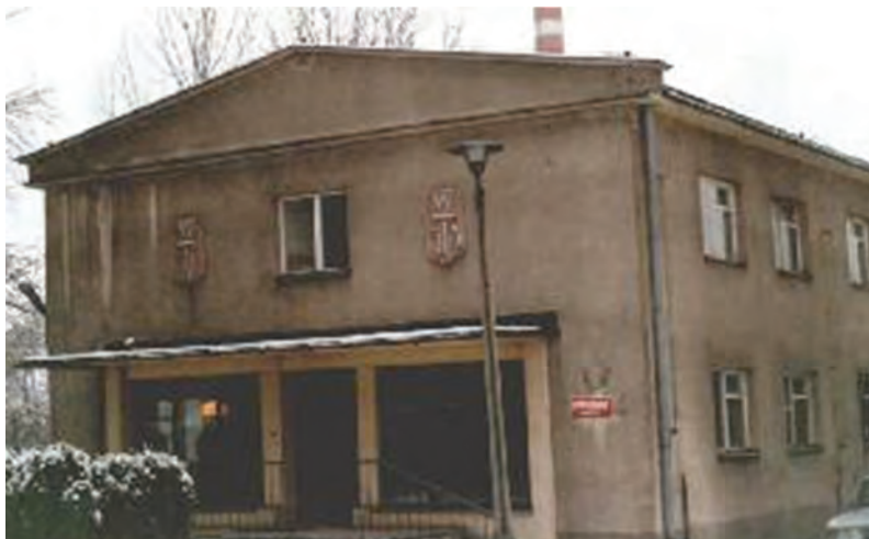
Budynek Muzeum Żup Krakowskich w Wieliczce (Park Kingi) - druga siedziba szkoły.