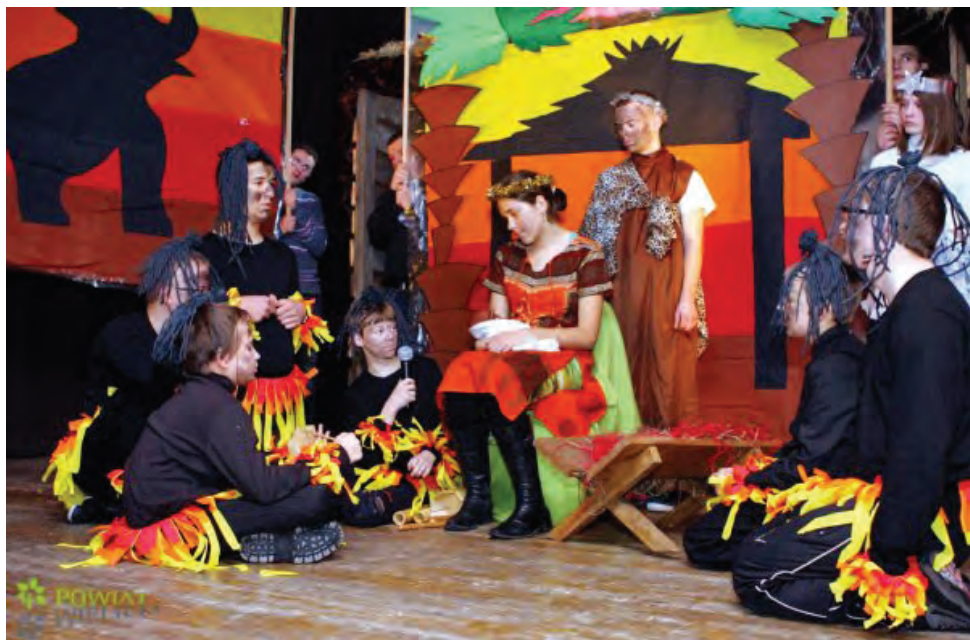
Misyjne Jasełka w wykonaniu uczniów szkoły – 2011 rok.