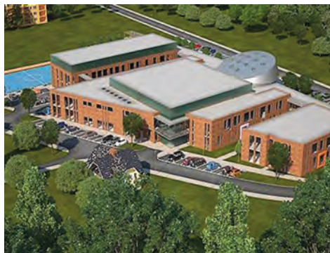
Wizualizacja nowego kompleksu oświatowego „Powiatowy Park Edukacyjny”.

Z ważnych wydarzeń z przeszłości szkoły należy wspomnieć również o zmianie w nazwie szkoły, która nastąpiła w roku 2003. Uchwałą Rady Powiatu w Wieliczce