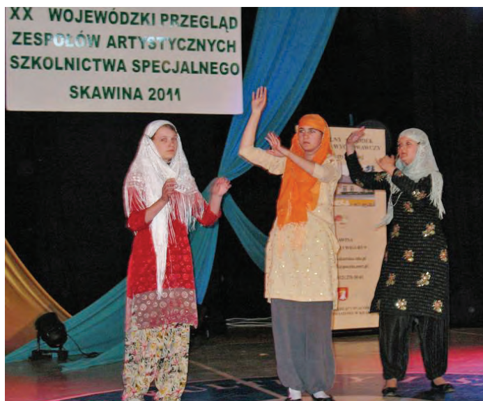
Występ dzieci w czasie Wojewódzkiego Przeglądu Zespołów Artystycznych Szkolnictwa Specjalnego w Skawinie – 2011 rok.

Każdego roku nasza placówka uczestniczy w Wojewódzkim Przeglądzie Zespołów Artystycznych Szkolnictwa Specjalnego w Skawinie, w którym wielokrotnie zdobywaliśmy wyróżnienia. Przygotowania do takiego występu trwają wiele tygodni. Dzieci uczą się swoich ról, przygotowują kostiumy, ćwiczą układy taneczne. W trakcie przygotowań uczniowie pracują nad perfekcją słowa i ruchu, a także nad umacnianiem wiary w siebie. Sprawdzają i rozwijają swoje umiejętności: aktorskie, literackie, plastyczne, wokalne, a także organizacyjne. Poprzez ekspresję dzieci mają możliwość uzewnętrznienia siebie, wyjścia ku światu. Uczą się współpracy w zespole, odpowiedzialności, tolerancji, kształtują więzi emocjonalne.