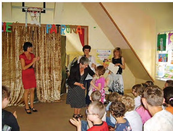
X Powiatowy konkurs plastyczny „Kto zmienił/zmienia świat na lepsze?” – 2011 rok.