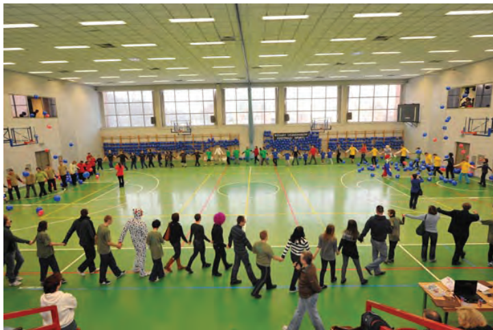
XII Festiwal Sportu – luty 2012 rok.