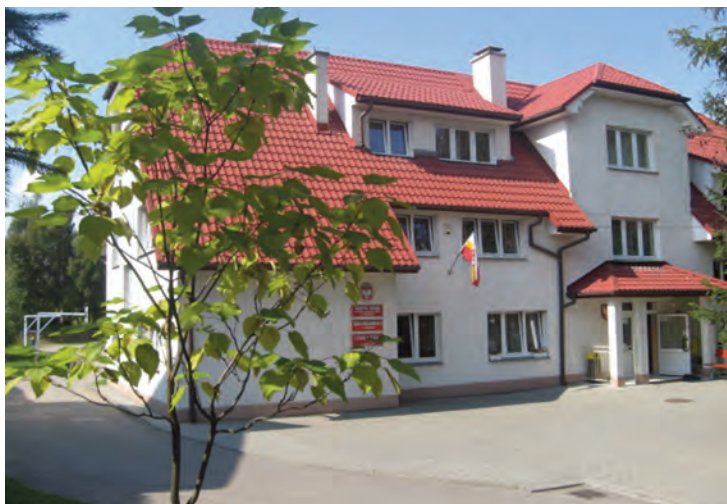
Budynek Zespołu Szkół im. Brata Alojzego Kosiby przy ulicy Niepołomskiej w Wieliczce.

W roku poprzedzającym przeprowadzkę do nowego budynku zaszły istotne zmiany w organizacji szkoły wynikające z przeprowadzonej reformy oświaty. Uchwałą Rady Powiatu w Wieliczce nr V/22/99 z dnia 29.03.1999 roku przekształcono Szkołę Podstawową nr 5 Specjalną w 6 – letnią szkołę podstawową, a uchwałą nr V/21/99 powołano do życia gimnazjum specjalne. Obwód tych szkół miał objąć wszystkie gminy powiatu wielickiego. Natomiast Uchwałą Rady Powiatu w Wieliczce nr VI/26/99 z dnia 28.06.1999 roku połączono Szkołę Podstawową Specjalną i Gimnazjum Specjalne w Zespół Szkół Specjalnych. W kolejnym roku uchwalono statut Zespołu Szkół Specjalnych (uchwałą nr XVI/70/2000 Rady Powiatu w Wieliczce z dnia 27.06.2000 roku).