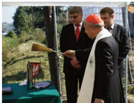
Poświęcenie kamienia węgielnego przez metropolitę krakowskiego ks. kardynała Stanisława Dziwisza – 23.09.2010 rok.