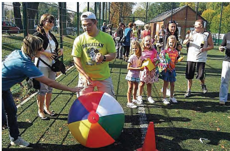
III Piknik Integracyjny „Orlik 2011”.

dzielnie i z pełnym zaangażowaniem walczyli o to, aby na końcu imprezy móc poszczycić się zdobyciem złotego medalu. W tej wspaniałej zabawie uczestniczyły również rodziny uczniów. Zachęteni pozytywnym odbiorem imprezy przez jej uczestników przystąpiliśmy do realizacji tego projektu w kolejnych latach i tak piknik integracyjny na wielickim Orliku odbył się już 3-krotnie. Ciekawostką jest, że naszym piknikowym spotkaniom towarzyszy zawsze nieprawdopodobna aura. Wyznaczona na tą imprezę sobota wita nas zawsze ciepłymi promieniami słońca, babim latem, liśćmi szeleszczącymi pod stopami. Prawdziwa złota polska jesień.