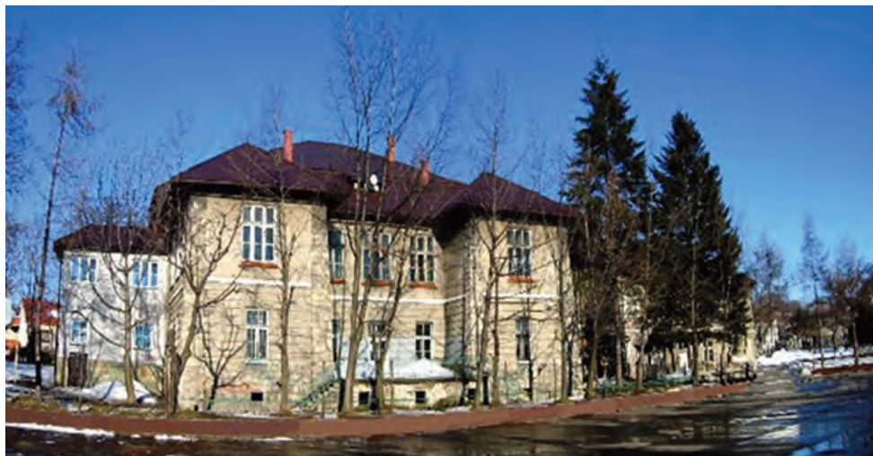
Budynek Szkoły Podstawowej nr 1 w Wieliczce (obecnie Gimnazjum nr 1) - pierwsza siedziba szkoły.